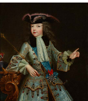
Louis XV par Augustin-Oudart Justinat