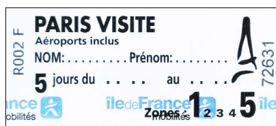
PARIS VISITE 5 JOURS, 5 ZONES

Tarifs sur Parisjetaime.com au 1 er décembre 2023.