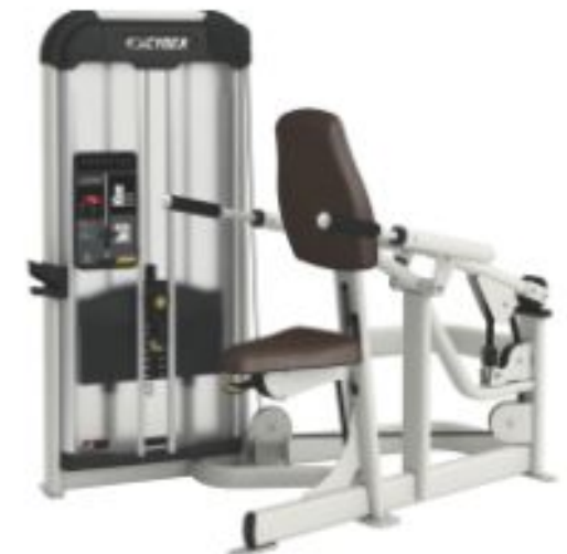
Presse à Triceps